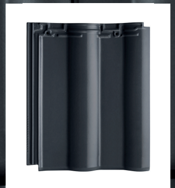
MAXIMA PRO leikleur engobe

DÉ MODULAIRE KERAMISCHE DAKPAN BIJ UITSTEK