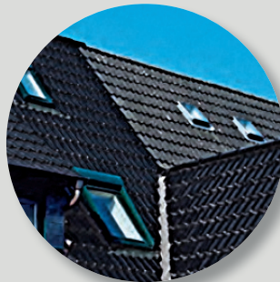
Renovatie met MAXIMA PRO

Ideaal voor de renovatie van oude(re) daken naar hoogwaardige klei. Want MAXIMA PRO kan dankzij haar dekbreedte van 300 mm perfect op bestaande latten van betondakpannen worden aangebracht (in geval van betondakpan 10 stuks/m 2 ).